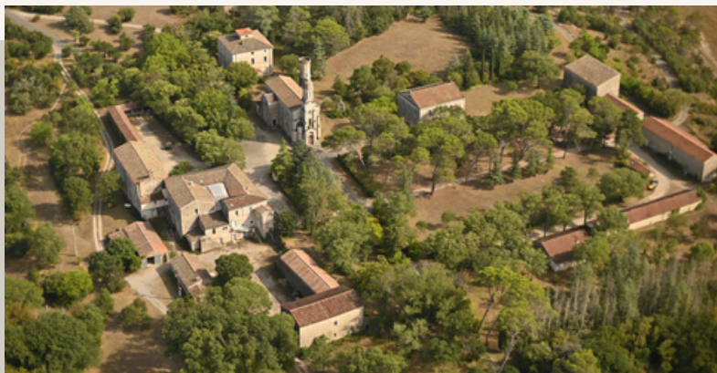
Notre Dame de la Gardiolle (30)