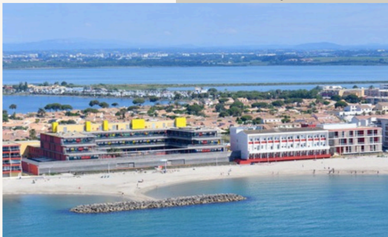
Palavas-les-Flots (34), siège de la Fondation Saint-Pierre

La Fondation Saint-Pierre déploie ce dispositif innovant sur 2 lieux de vie , à savoir Palavas-les-Flots, station balnéaire qui borde la mer Méditerranée (34) et Notre Dame de La Gardiolle, domaine au cœur de la nature, dans le magnifique Piémont cévenol (Conqueyrac 30).